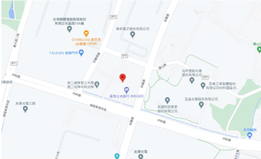
圖 1 科學園區同業公會地理位置