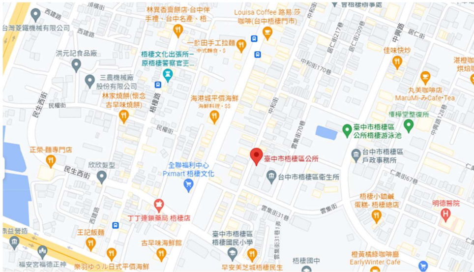
圖 3 臺中市梧棲區公所地理位置